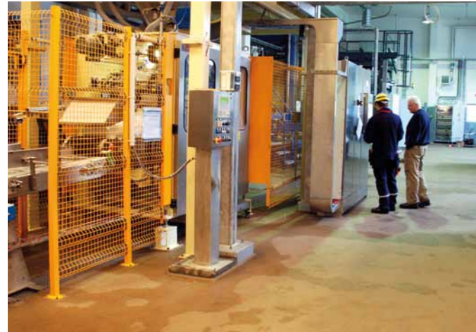
ATB-300® beläggningarna är baserade på krympfri vinylesterplast med extremt hög kemisk och termisk resistens.