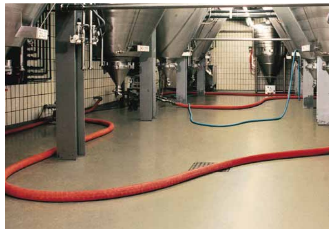
Duracon® akrylbeläggningar är slitstarka och snabbhärdande. Motstår kraftiga belastningar av mekanisk, kemiskt och termisk natur.