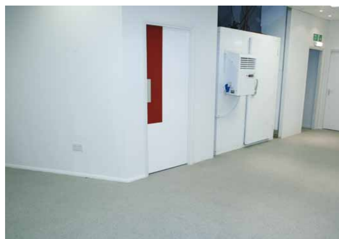
En vattenbaserad epoximålning för väggar och tak inomhus, till exempel i våta miljöer med höga krav på slitstyrka och hygien.