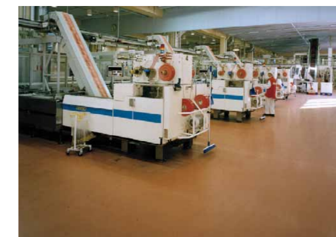
En polyuretanbaserad golvbeläggning för ytor som kräver hög kemikalieresistens och som utsätts för hetvatten och ångtvätt.