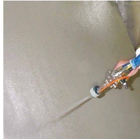
ATB-300® SC kan även appliceras med spraypistol.