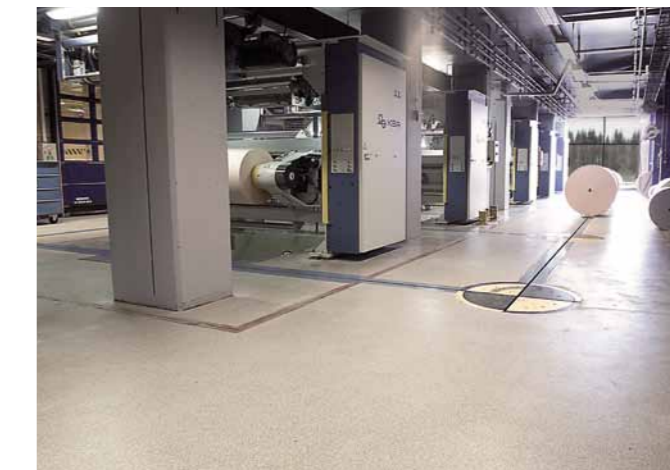
En dekorativ epoxibeläggning med polyuretaninfärgad sand. Lämplig i både torra och våta miljöer med tung trafik.