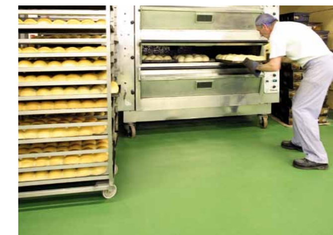
En mycket kemikalieresistent polyuretanbeläggning för industrier med tung och intensiv trafik med höga hygieniska krav.