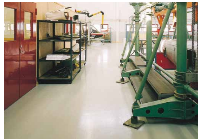
En självnivellerande slitstark epoxibeläggning för ytor med tung och intensiv trafik.