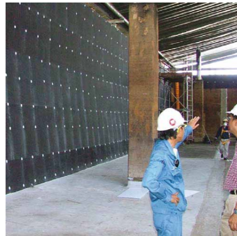
ATB-300® Honeycomb C polypropylenplatta isolerar från existerande underlag och möjliggör applicering på vått underlag. Används endast i kombination med ATB-300® GL Laminat.