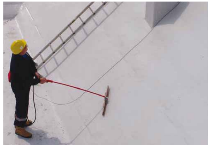
ATB-300® GL Laminat är en UV-resistent vinylester varvad med glasfiber. Kan appliceras för hand med glasfibermatta eller sprayappliceras.