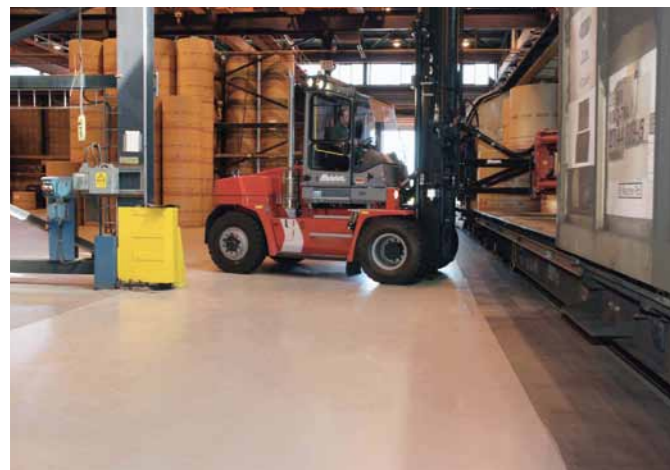
En enkel och slitstark vattenbaserad epoximålning för lätt industri.