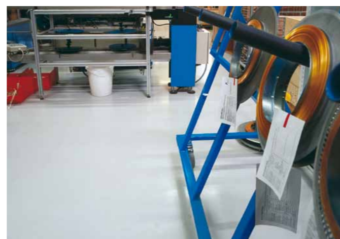
Ett elavledande epoxibaserat golvsystem för miljöer med tung och intensiv trafik. Godkänt enligt EN norm IEC 61340-5-1.