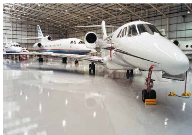
En högkvalitativ, lösningsmedelsfri epoximålning med god kemikalieresistens.