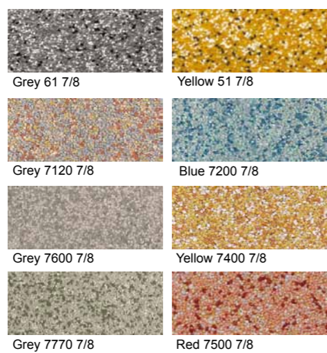
Fler färger och mer information finns på systemdatablad som kan beställas hos vår kundservice eller laddas ned från vår hemsida.