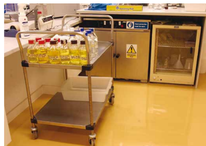
En självnivellerande flexibel polyuretanbeläggning. För lättare industrier där krav på hygien och flexibilitet föreligger.